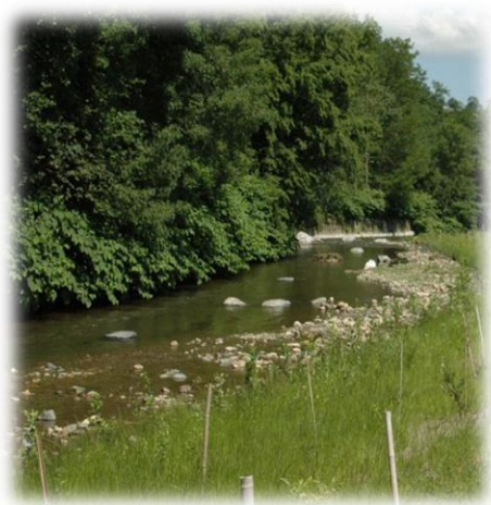
La Brévenne (69)

Pour les mesures concernant les débits réservés : identifier dans la mesure du possible les ouvrages concernés.