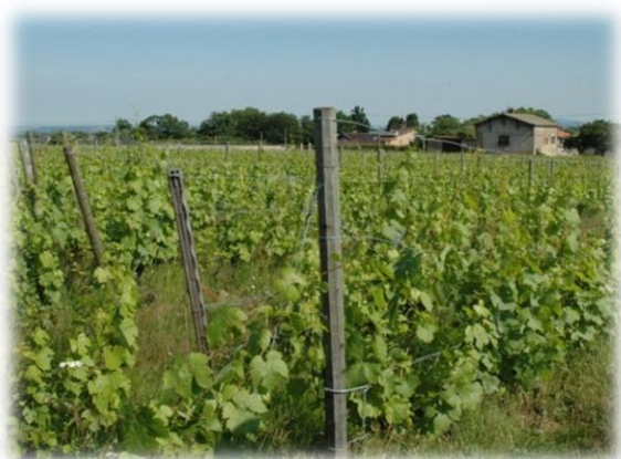
Vignes biologique du Beaujolais (69)

Concernant les masses d'eau souterraines en zones vulnérable, seuls les reports de délai pour la cause "conditions naturelles" pourront être proposés, si le temps de réponse du milieu suite à la mise en œuvre des mesures est estimé supérieur à la durée du plan de gestion.