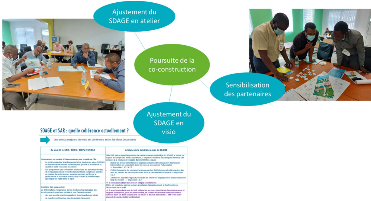
Figure 2 : Aperçu en images du processus de co-construction pour la finalisation de SDAGE et de PDM

Ce dispositif a généré 95 retours, parmi lesquels 79 ont entraîné une modification des documents, 6 figuraient déjà dans les documents et 10 constituaient des points de vigilance n'ayant pas entraîné de modification.